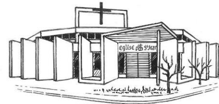
Église St-Jean 7 rue Jean Racine