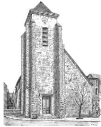
Église Saint Jacques – Saint Christophe