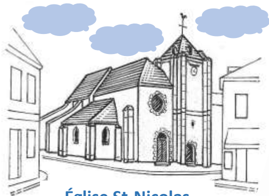
Église St-Nicolas rue Jean Jaurès