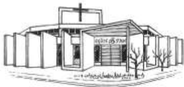
Église Saint Jean-l'Évangéliste