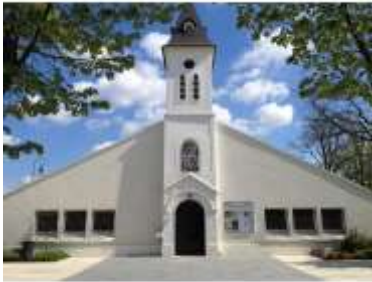
Église Saint Jean-Baptiste