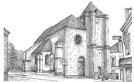
Église Saint Nicolas