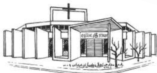
Église St-Jean 7 rue Jean Racine